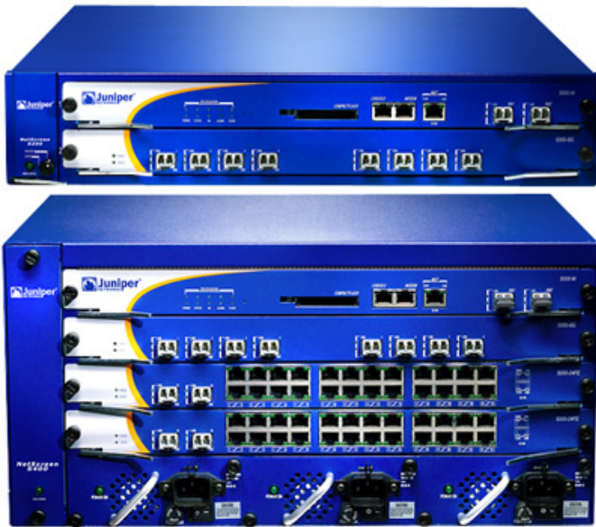
Juniper Netscreen серий 5200, 5400

Семейство универсальных продуктов, объединяющих функции межсетевого экрана, VPN шлюза/концентратора, маршрутизатора, IPS (IDP/Deep Inspection), антивирусного сканнера (от лаборатории Касперского), антиспамовой системы (от Symantec) и URL-фильтра (от SurfControl и WebSense), менеджера полосы пропускания. Совмещение функций не влечет за собой ограничений по производительности благодаря использованию в устройствах высокоскоростных универсальных процессоров и специализированных микросхем ASIC.